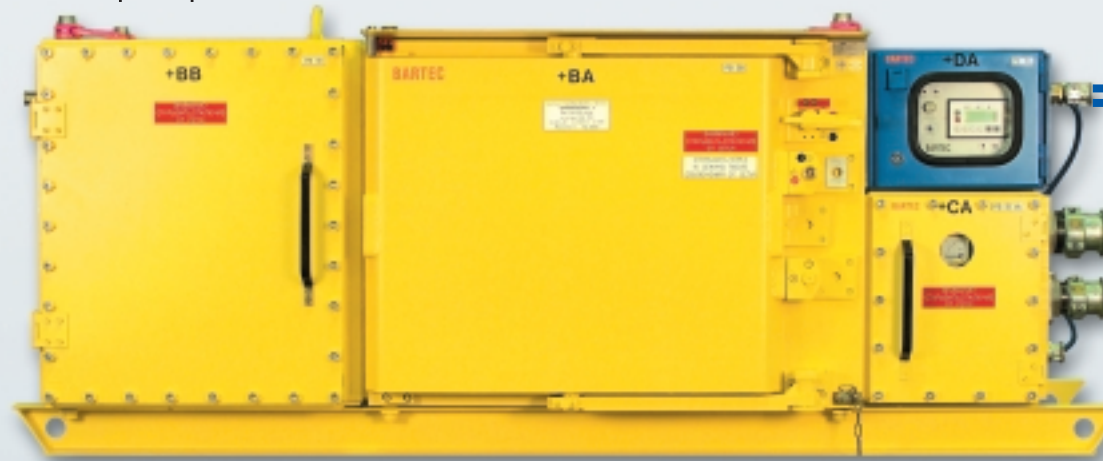
Питание: 1140 В, 50 Гц