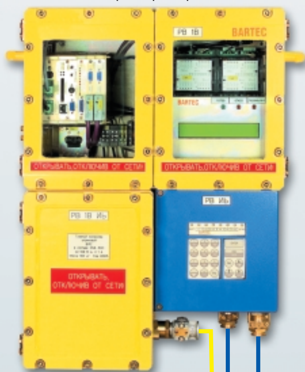
Питание: 220 В, 50 Гц