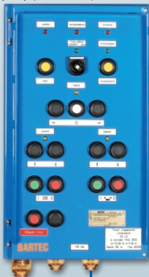
Пульт управления штрековый SP 1.0