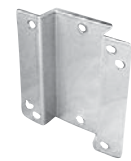
WB Стенная крепежная консоль