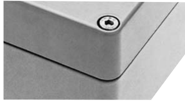
Болт с внутренним шестигранным шлицем

Материал: никелированная латунь, 10 x 3 (5) мм