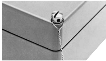
Пломбируемые винты для крышки

Материал: алюминий, пластик Угол поворота: ок. 170°